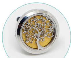
Arbre de vie