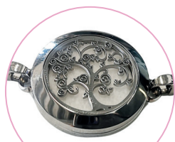
Arbre de vie