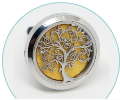
Arbre de vie