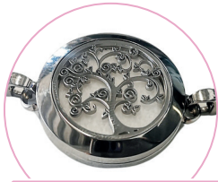
Arbre de vie